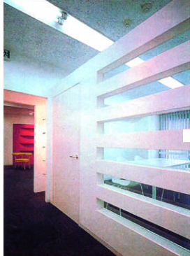
上/エレベーターホールからエントランス見る 中央/打ち合わせスペース